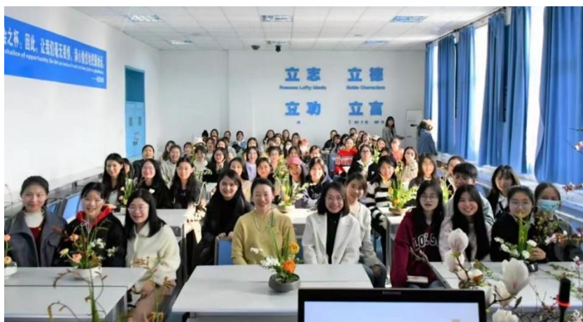
图：2023年“青春年华，花漾之约”插花美学课堂

从日常生活美学出发的审美涵育课堂旨在引领学生健康文明的行为习惯和生活方式。分中华文明之美——茶文化、香道礼仪、人文花道等课程，以此实现生活艺术课的规范教育作用、道德教育作用和审美教育作用，提升学生人文素养。