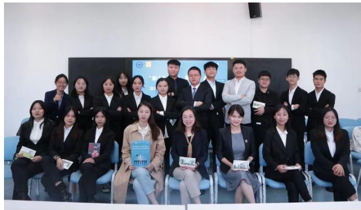
图：社交礼仪工作坊，一次训练，一次成长