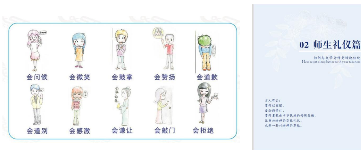
图：基于“文明十会”的礼仪细节教育

把日常生活中的行为规范凝练成“文明十会”倡导语，即：会问候、会微笑、会鼓掌、会赞扬、会道歉、会道别、会感激、会谦让、会敲门、会拒绝，倡导学生自觉遵守礼仪规范，提高人际交往水平，提升自身的涵养和素质。