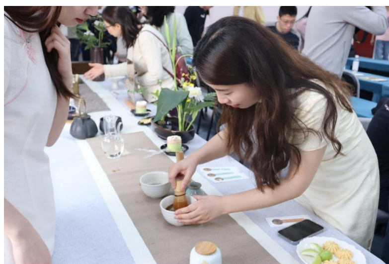
图：辅导员老师指导学生进行点茶