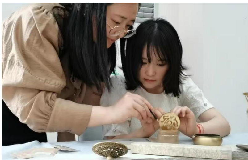
图：辅导员老师指导学生香道