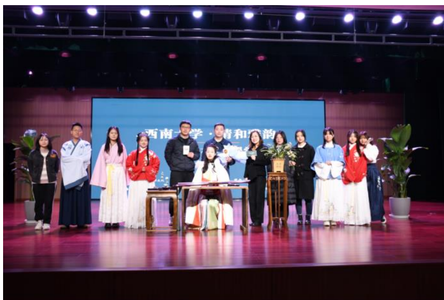
图：2022年举办西南大学古琴艺术赏析课堂

琴以载道，千百年来古琴一直被文人士大夫高度尊崇，其地位列文人四艺的“琴、棋、书、画”之首。通过面向全校学生开展古琴赏析课堂，让学生在沉浸式、体验式的音乐欣赏中近距离感受古琴艺术和中华优秀传统文化的魅力，提升学生人文素养，提升文化育人效果。