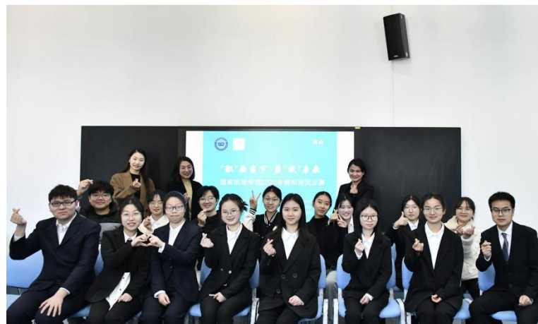
图：同学们满满的收获、会心的微笑