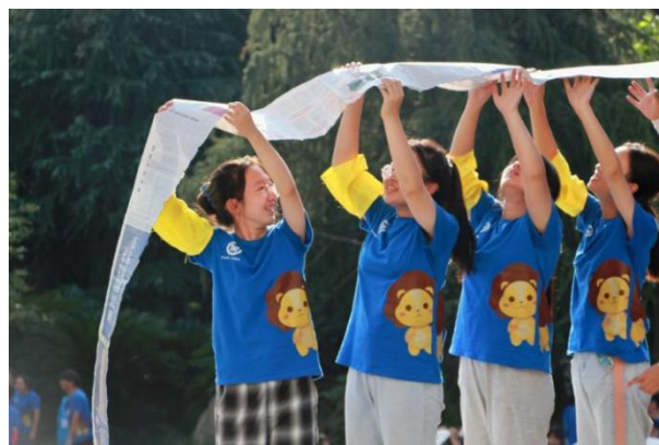
图：2022年新生入格素质拓展训练